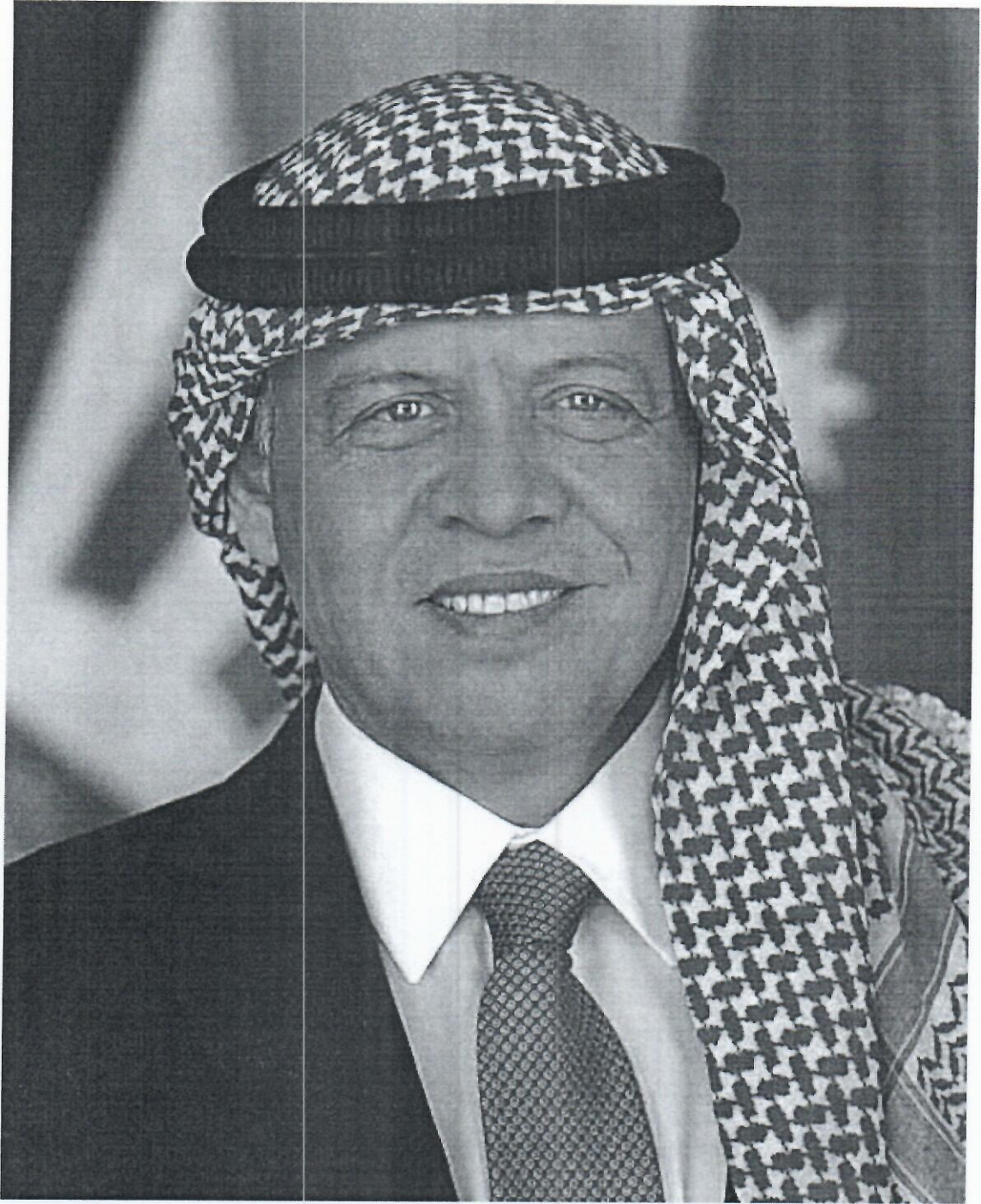
حضرة صاحب الجلالة الهاشمية الملك عبدالله الثاني بن الحسين المعظم