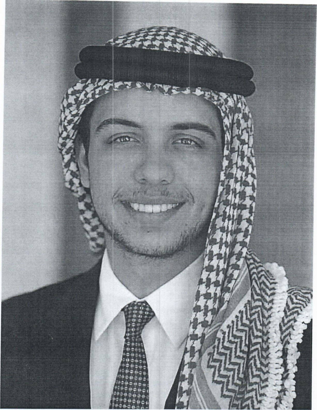
حضرة صاحب السمو الملكي الأمير الحسين بن عبدالله الثاني ولي العهد المعظم